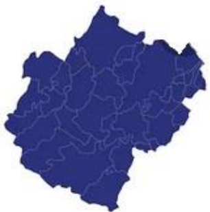
Tabella comuni Forlì