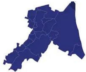
Tabella comuni Ravenna