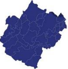
Tabella comuni Cesena